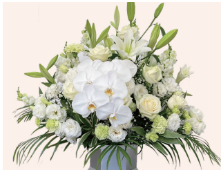
洋花 /1対 33,000円 (税込)