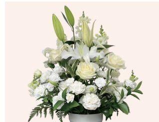
洋花 /1対 11,000円 (税込)