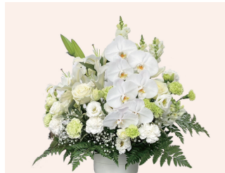
洋花 /1対 22,000円 (税込)